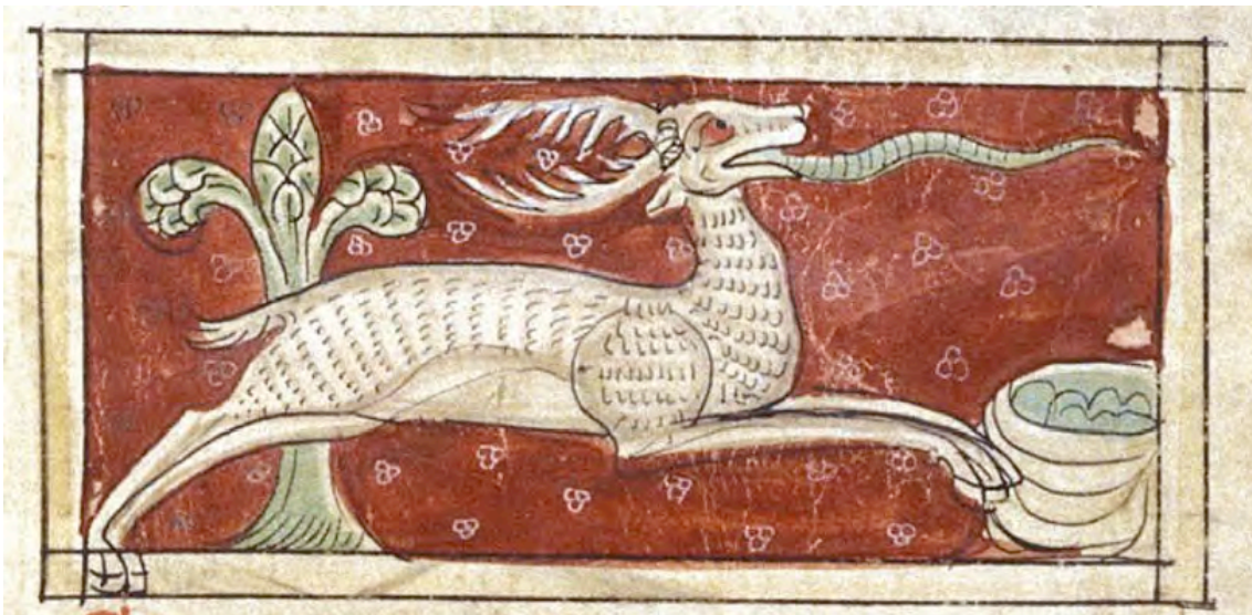
Bestiary. Inghilterra (siglo XIII)