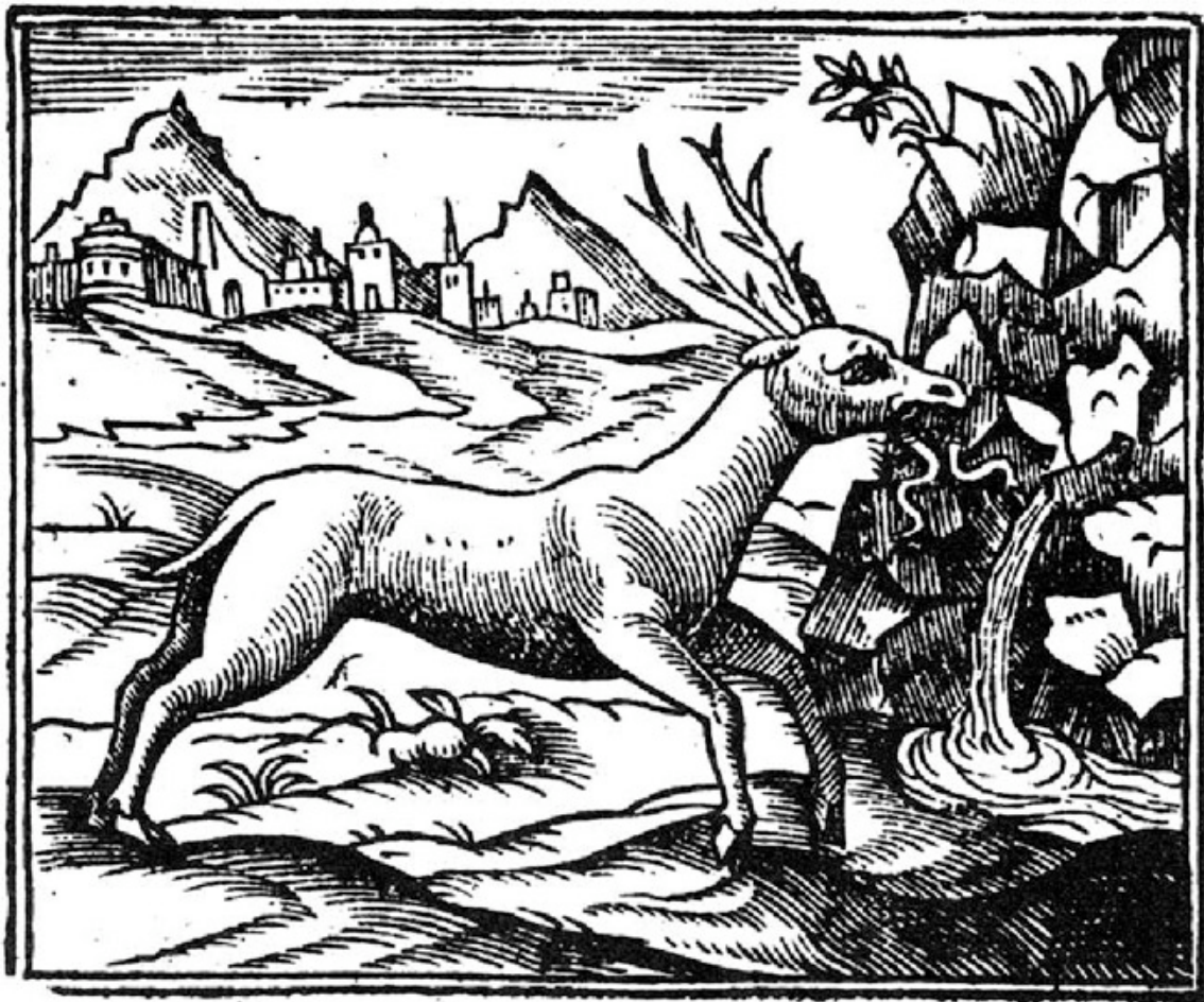
Physiologus, Roma (siglo XVI)