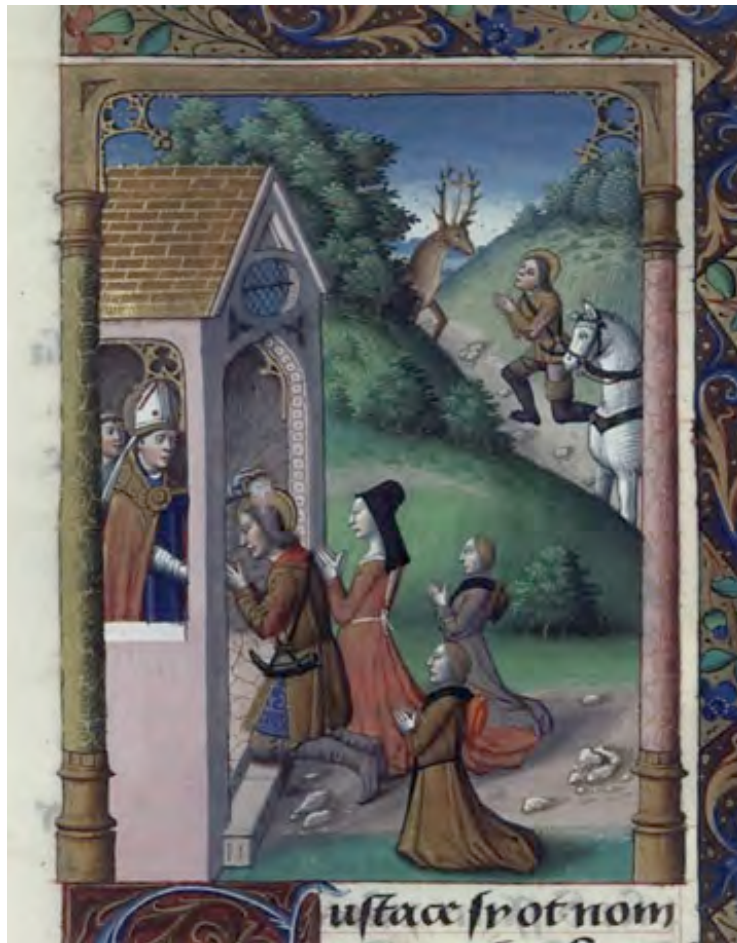
Jacques de Besançon, Vision de saint Eustache (siglo XV)