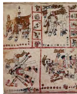
Códice Vaticanus b 77v

No es posible, con los datos de que disponemos, ofrecer una interpretación exacta del significado de estas imágenes ni dar una explicación satisfactoria al hecho (si este se considerase probado) de que el ciervo representado en ambos códices esté comiendo una serpiente. Lo que sí parece descartable es que la representación del ciervo ingiriendo una serpiente se deba a una observación directa de la naturaleza, ya que es bien sabido que el ciervo es un animal fitófago puro, cuya dieta, exclusivamente vegetariana, consiste en hierbas, yemas y cortezas de árboles, frutos, musgos, hojas, bellotas, castañas y moras.