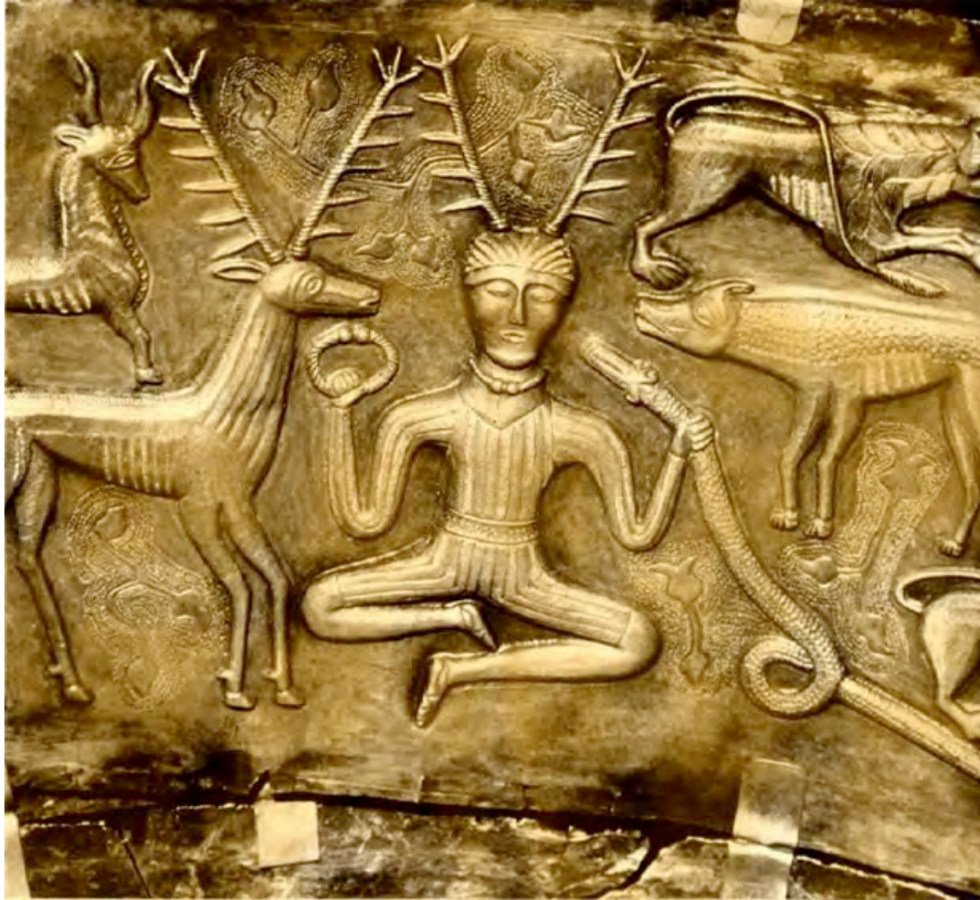
Representación del dios Cernunnos en el caldero de Gundestrup (siglo II a. C.)