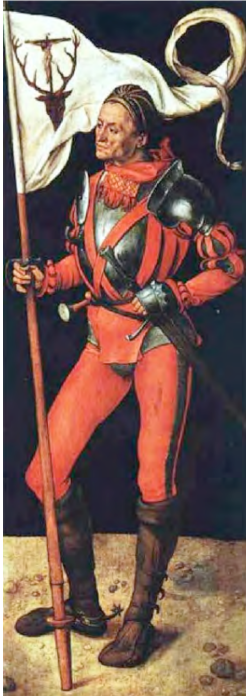
San Eustaquio, Alberto Durero (c. 1503) Alte Pinakothek, Munich.