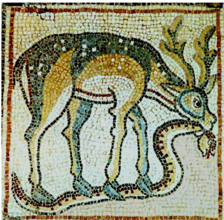
Mosaico bizantino de Qasr Libia (siglo VI)