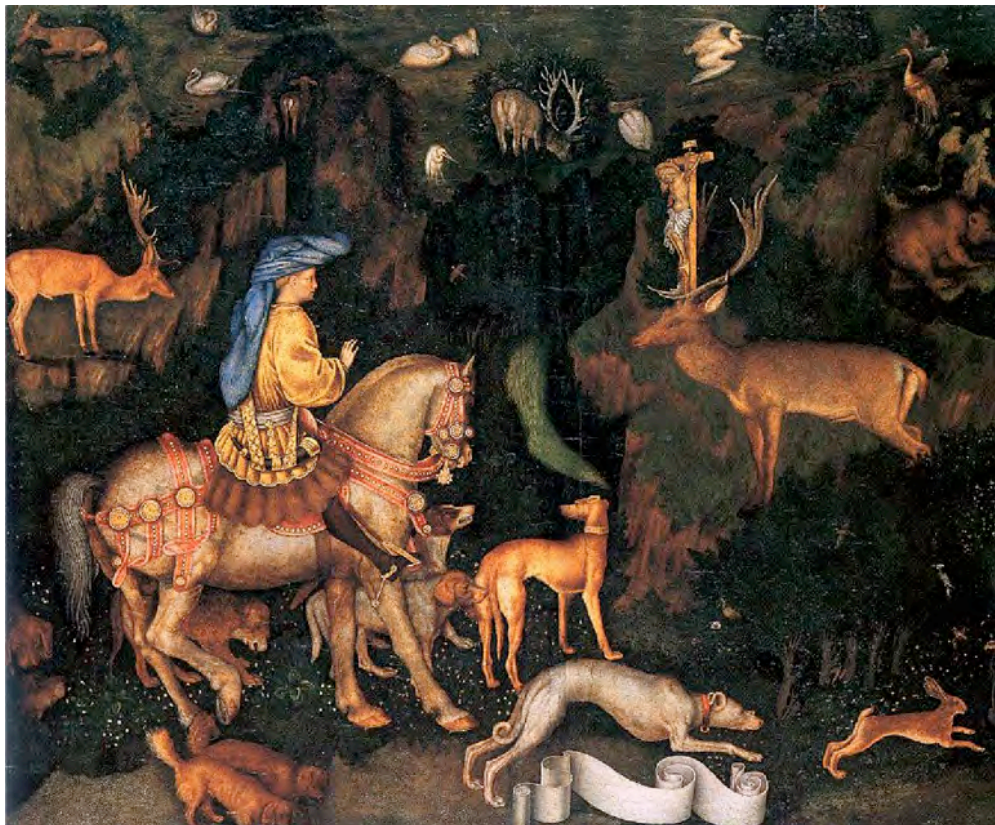
La visión de san Eustaquio , Pisanello (c. 1440) National Gallery, Londres.