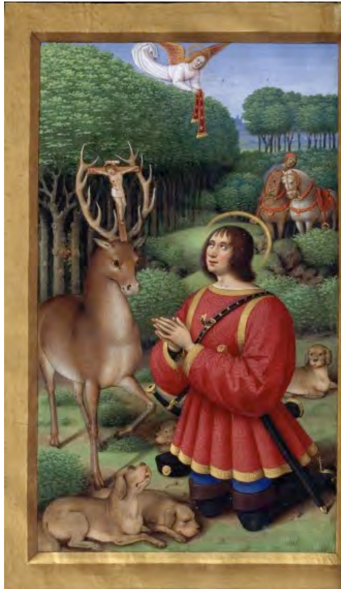
Jean Bourdichon, Vision de Saint Hubert (siglo XVI)