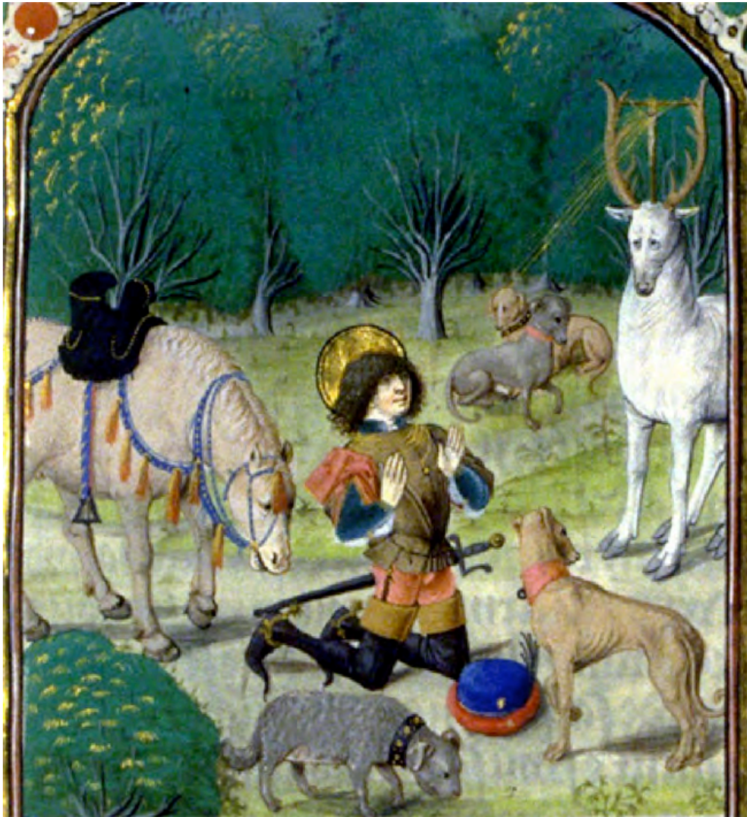
Hubert Le Pévost: Die Vision des Hubertus, aus der Légende Saint-Hubert, in der Bibliothèque Nationale de France.