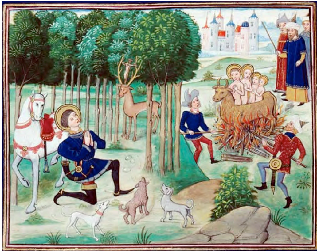
La leyenda de san Eustaquio (siglo XV) Santiago de la Voragine, La leyenda dorada , Bruges, traducida por Jean de Vignay. Mâcon, Bibliothèque municipale, ms. 3, fol. 12v.