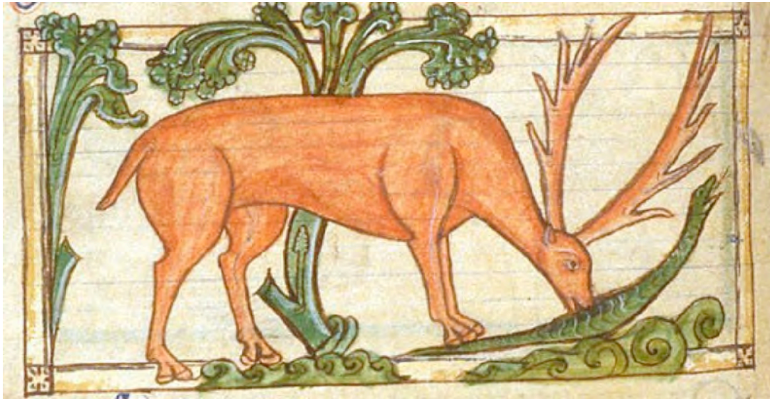
Theological miscellany. Inghilterra (siglo XIII)