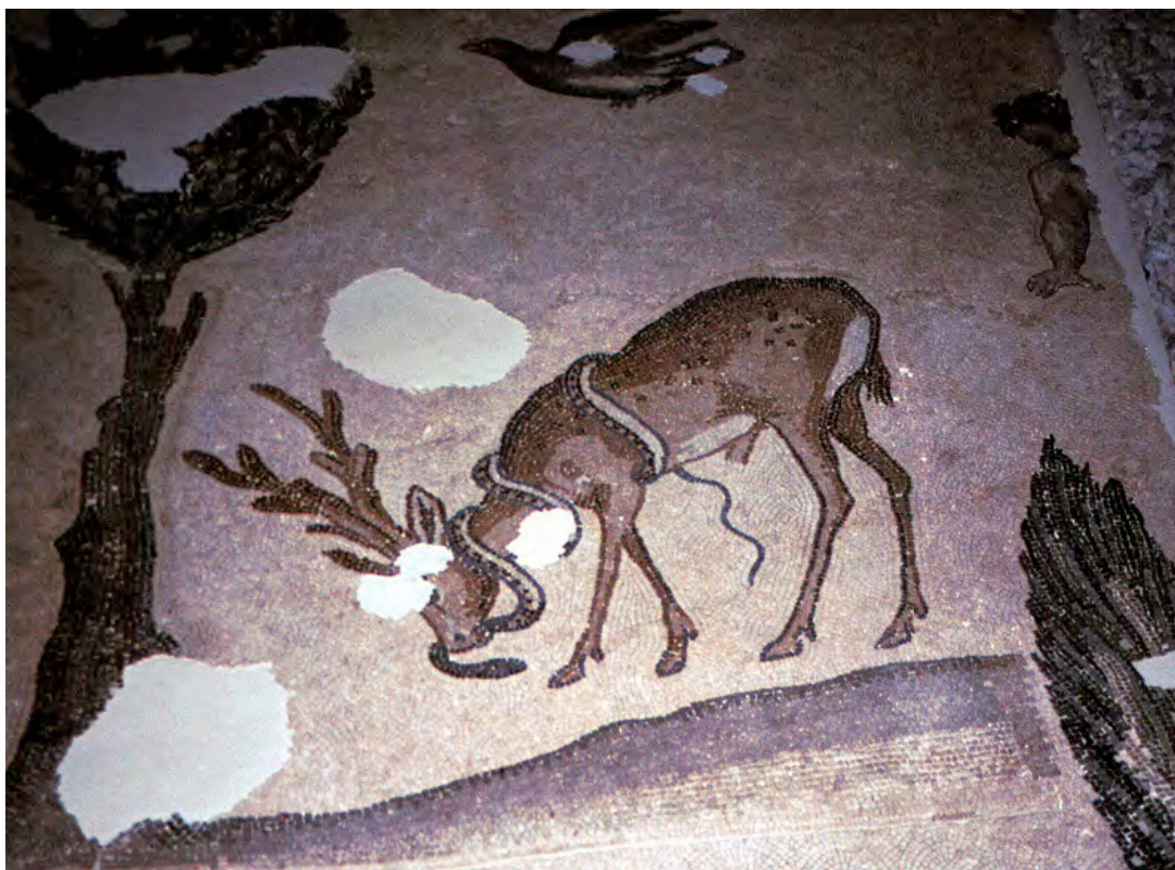
Mosaico del Gran Palacio, Estambul (siglo V)