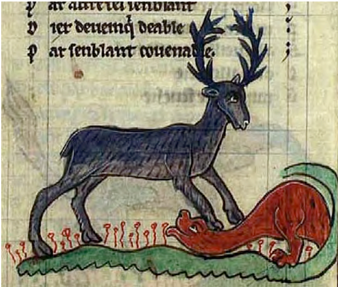
Bestiaire de Gervaise (siglo XIII)