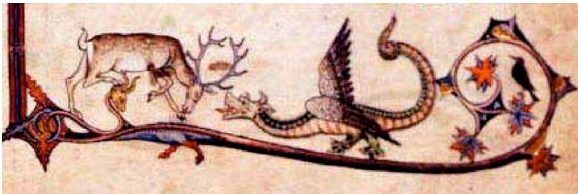
Stag (Christ) and dragon (Satan) (siglo XIII)