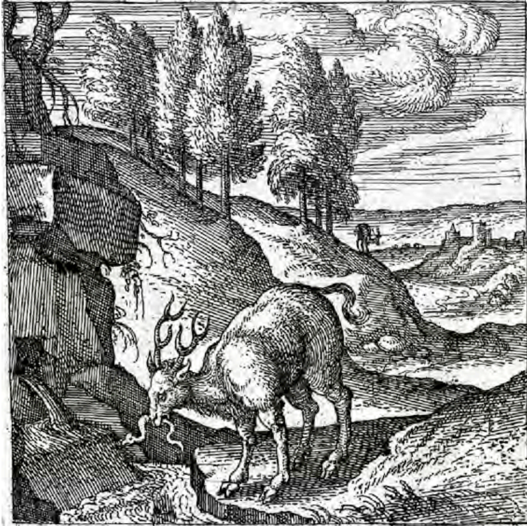
Physiologus , grabado Van der Borcht (siglo XVI)