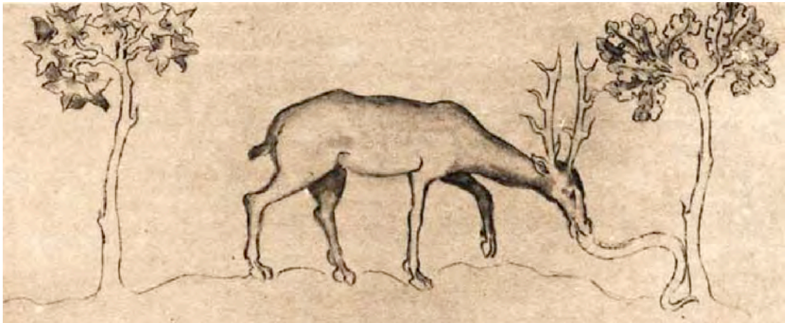
The Queen Mary Psalter, Inglaterra (siglo XIV)