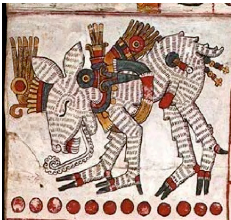
Códice Borgia, recto 22 (detalle)

La imagen que acabamos de mostrar es una representación de un ciervo sagrado que se encuentra en el Códice Borgia, manuscrito pictográfico mexicano de época prehispánica que se conserva actualmente en la Biblioteca Vaticana. No se conoce el lugar exacto de origen de este códice; sin embargo no hay duda de que es originario de las tierras centrales de Méjico (posiblemente de cerca de Puebla o del Valle de Tehuacán), un área que estuvo bajo dominio azteca en la época de la conquista. Se trata de un manuscrito ritual, pintado sobre piel de ciervo, que reúne textos mágicos, religiosos y adivinatorios, incluye observaciones astronómicas y representa el famoso Tonalpohualli o calendario de 260 días. Es comúnmente aceptado que este códice fue pintado antes de la llegada de los españoles, por lo que se considera exento de influencias europeas. Y es precisamente esa supuesta falta de influencia europea la que hace que la imagen de este ciervo sagrado se torne inquietante a nuestros ojos. ¿Qué es esa cosa serpentiforme que se encuentra en la boca del ciervo? No parece que pueda tratarse de la lengua, ya que esta se muestra claramente en una imagen contigua, dentro de la misma página: