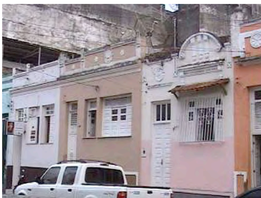
Fig 05: Casas com platibanda em bom estado de conservação.