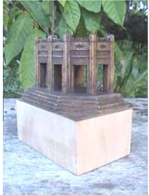
Fig 09: Escultura inspirada na fachada da casa da figura 05.