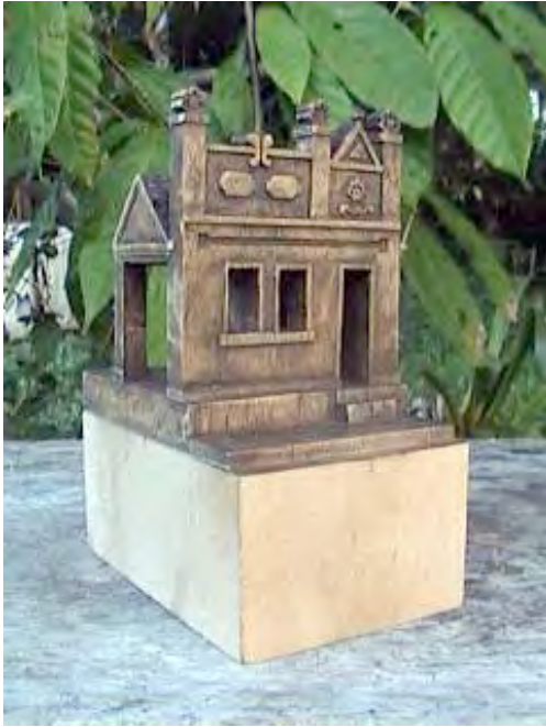
Fig 08: Escultura inspirada em fachada da casa da figura 04.