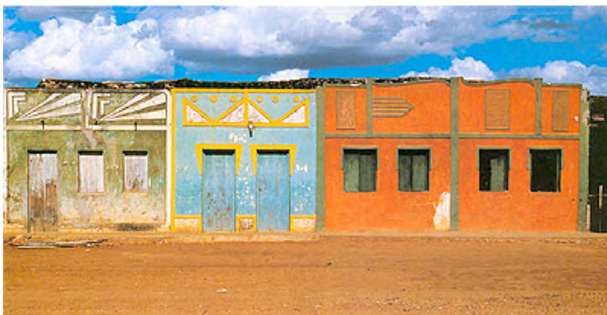
Fig 02: Casas com platibandas em Caratácá, Bahia.

No início dos anos de 1970, a artista carioca Anna Marianni dedicou-se a fotografar a arquitetura, a cultura, a fauna e a flora, a paisagem e a vida cotidiana nessa região do Brasil. Em 1976, a fotógrafa enfoca as fachadas e platibandas das casas populares reunindo, em 11 anos de pesquisa, um acervo de mais de 2 mil fotografias. Destas, seleciona 220 fotos e publica o volume Pinturas e Platibandas , com comentários do escritor Ariano Suassuna e da arquiteta Lina Bo Bardi. O livro é lançado na 19ª Bienal Internacional de São Paulo com exposição de 80 ampliações fotográficas.