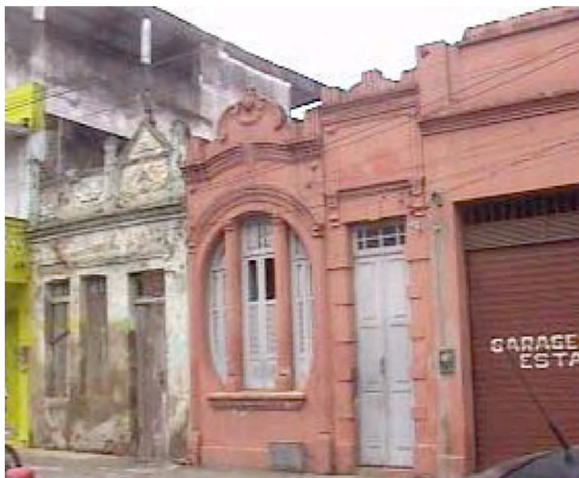
Fig 04: Casas com platibanda em péssimo estado de conservação, cujo interior foi demolido.

Importa salientar também que grande número dessas construções encontra-se em situação de risco, como a ilustrada na figura 04, cujo interior foi demolido. A figura mostra casas com platibanda na mesma rua do centro da cidade em bom estado de conservação, mas que poderiam receber uma pintura que valorizasse os detalhes da ornamentação.