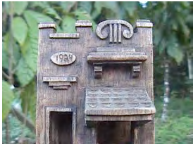
Fig 10: Escultura inspirada na fachada casa da figura 07 Fig 11: Destaque para platibanda ornamentada com indicação do ano da construção (1924)

A adoção dessa estética atrai também o olhar do turista, reportando ao estudo de Tuan (1980). Contudo, vale ressaltar que a inserção do escultor no contexto local proporcionou-lhe vivência e interação com as referências identitárias da cidade. Assim, sua apropriação dessa paisagem para as esculturas corresponde ao que Yúdice chama de “uso da cultura como recurso para a melhoria das condições sociopolíticas e econômicas” (2004, p. 25), suscitando